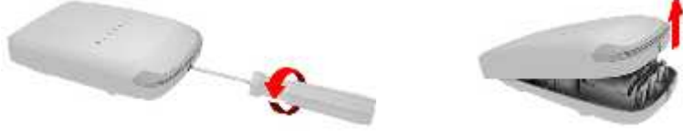
ekil 2: Kapa ın çıkartılması

E er sireninizde batarya mevcutsa, a a ıdakileri yapın: